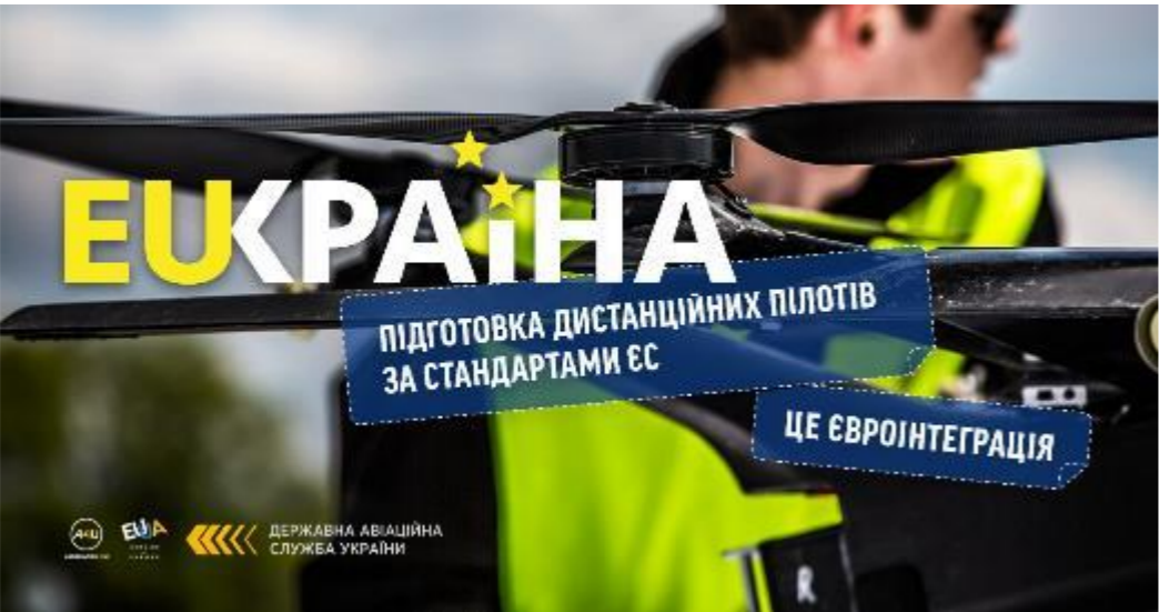
в партнерстві з Державною авіаційною службою