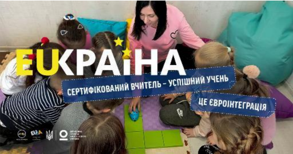
в партнерстві з Державною службою якості освіти