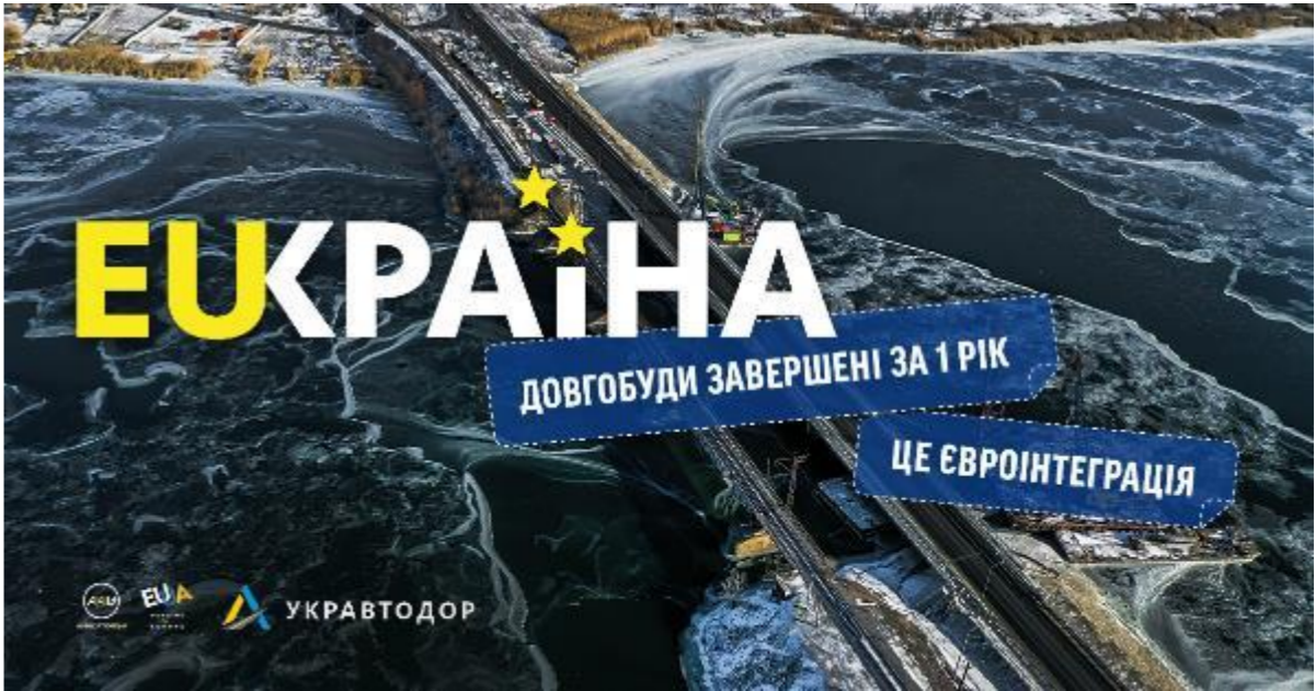
в партнерстві з Укравтодор