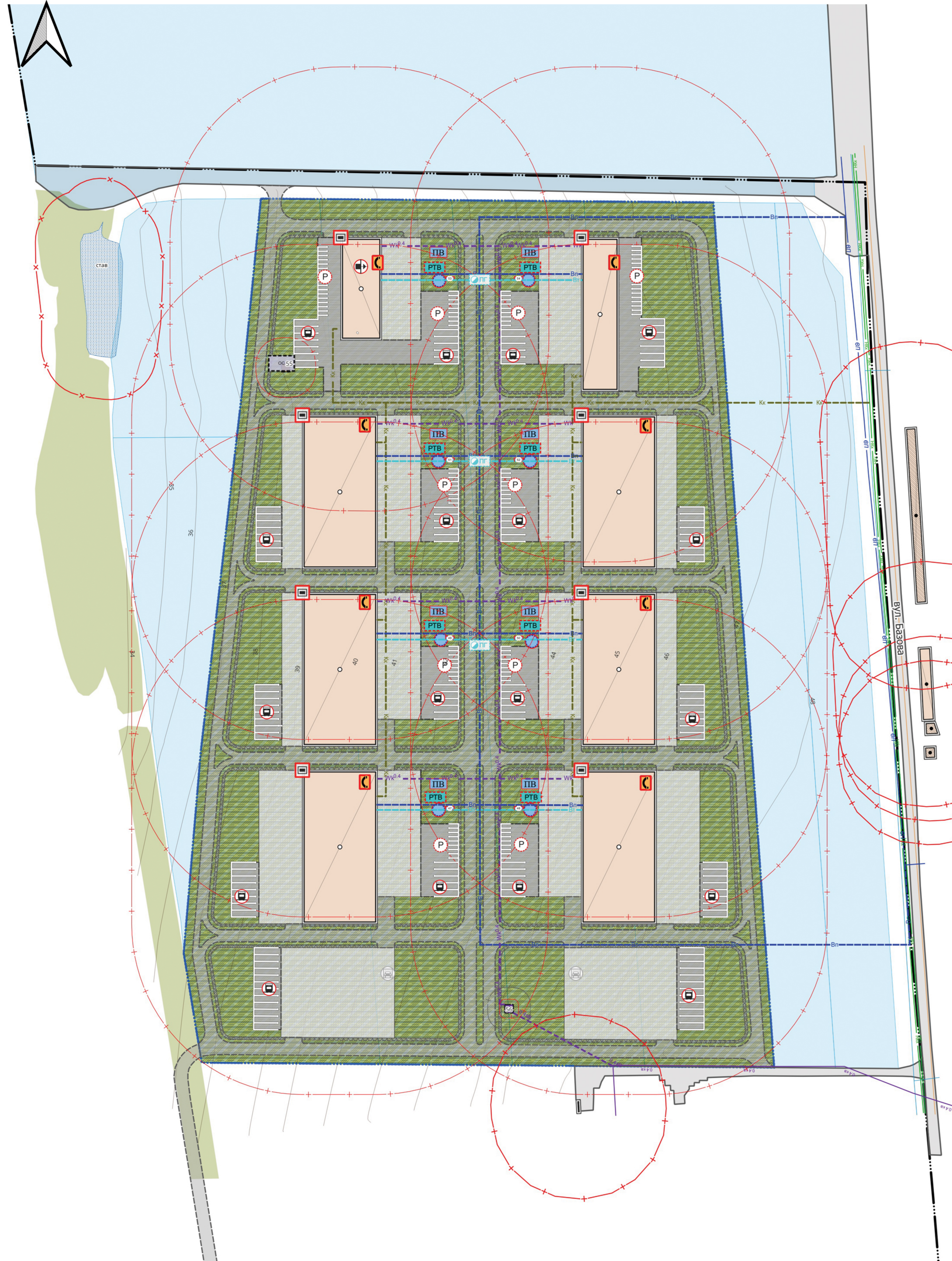
СХЕМА ІНЖЕНЕРНОГО ЗАБЕЗПЕЧЕННЯ ТЕРИТОРІЇ М 1:1000